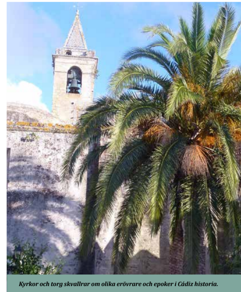
Kyrkor och torg skvallrar om olika erövrare och epoker i Cádiz historia.

på jakt efter den perfekta vägen och den ultimata solblekta saltvattensfrisuren.