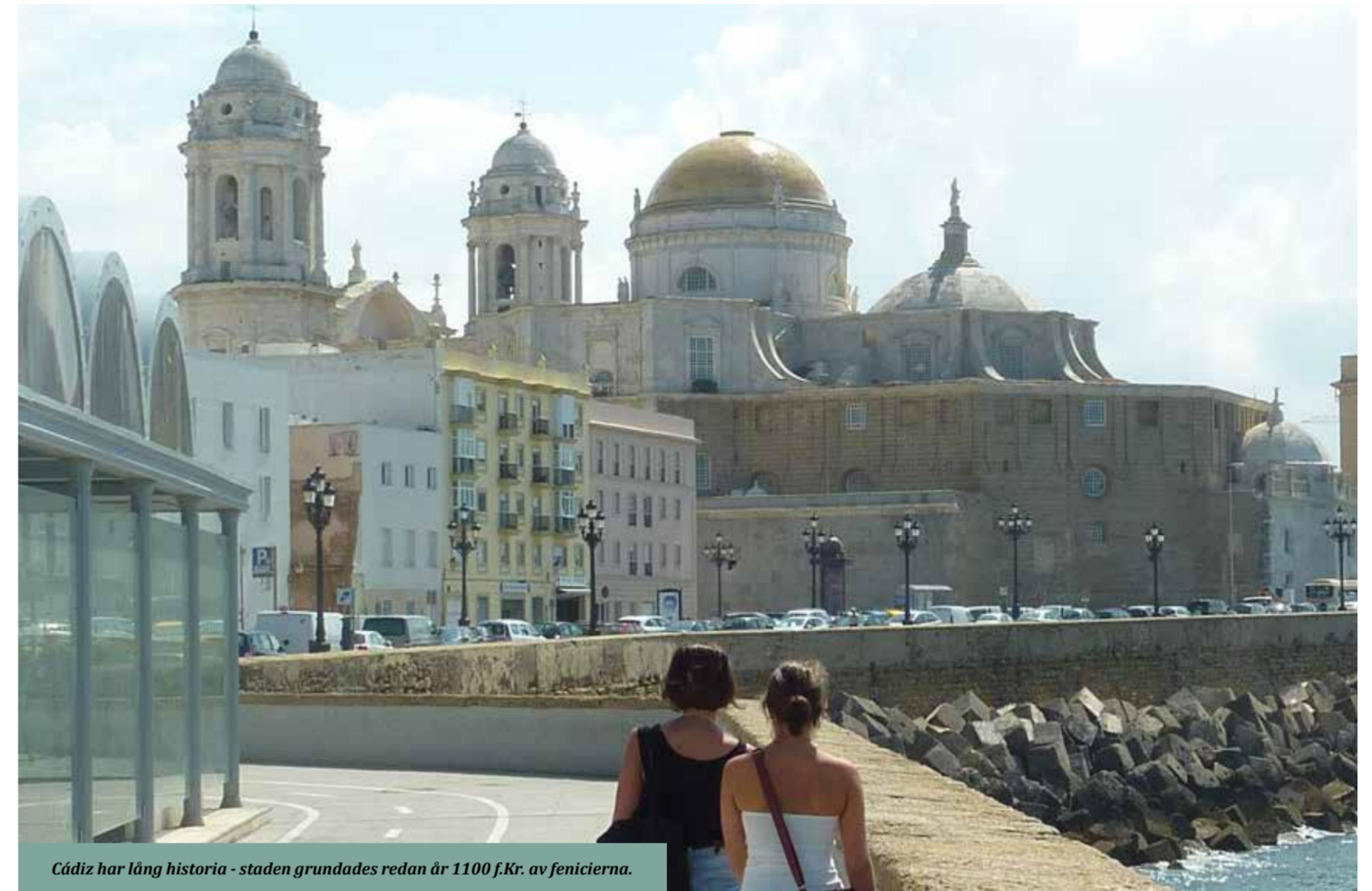
Cádiz har lång historia - staden grundades redan år 1100 f.Kr. av fenicierna.