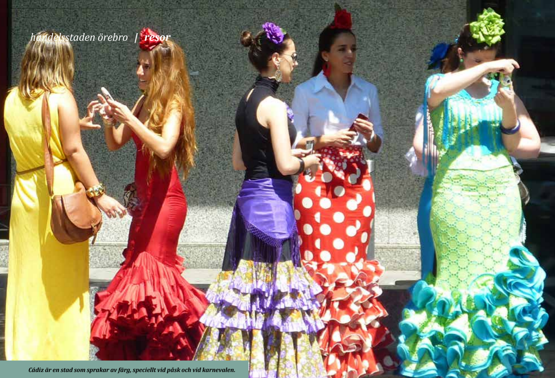
Cádiz är en stad som sprakar av färg, speciellt vid påsk och vid karnevalen.