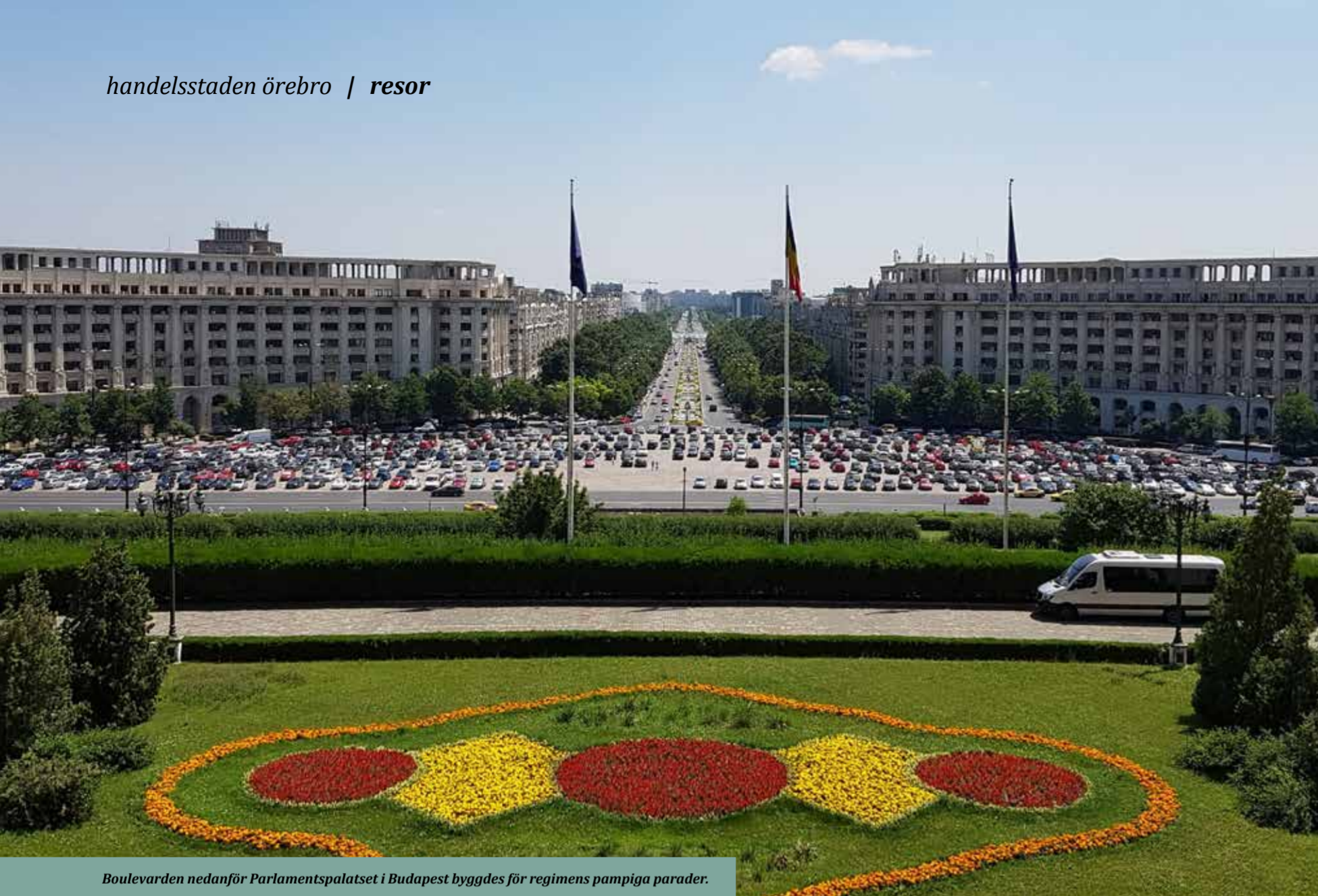
Boulevarden nedanför Parlamentspalatset i Budapest byggdes för regimens pampiga parader.