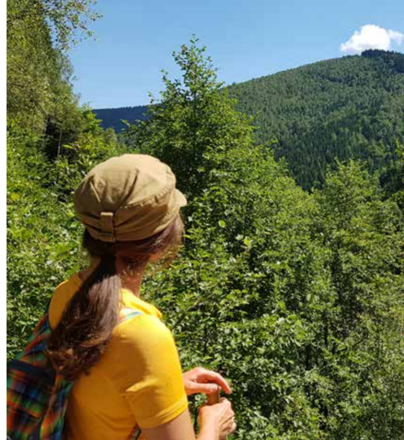
I de rumänska urskogarna lever många av Europas vilda brunbjörnar.

utställena. I Brasov kan du besöka Svarta Kyrkan, det svarta och vita tornet, fortet och andra medeltida byggnader. Utanför staden finns fler sevärdheter: