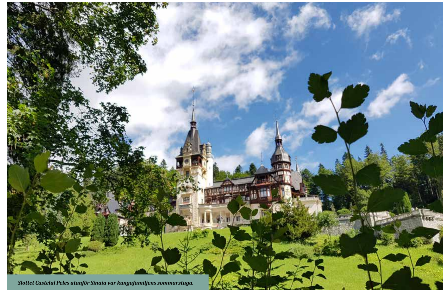
Slottet Castelul Peles utanför Sinaia var kungafamiliens sommarstuga.