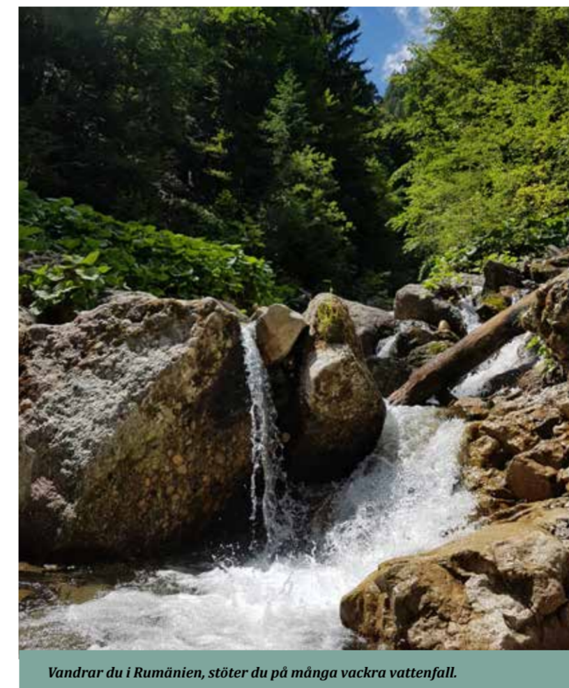
Vandrar du i Rumänien, stöter du på många vackra vattenfall.

nästa största administrativa byggnad och givetvis en av de dyraste som någonsin byggts. En miljon kubikmeter marmor, 3 500 ton kristallglas och 1 100 rum säger en del om storleken, även om den måste upplevas på plats för att man verkligen ska förstå dess pampighet. Den byggdes för att vara Rumäniens administrativa, styrande hjärta men kallas faktiskt än idag Folkets Hus av många rumäner.