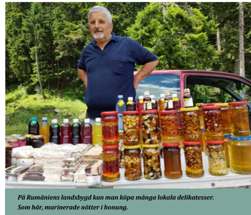
På Rumäniens landsbygd kan man köpa många lokala delikatesser. Som här, marinerade nötter i honung.

Under diktatorn Ceausescus regeringstid förstördes tyvärr de flesta gamla, vackra byggnader i ett urbaniseringsprojekt. Däremot byggdes det kanske mest (ö)kända byggnaden av dem alla - Parlamentspalatset. Det är världens