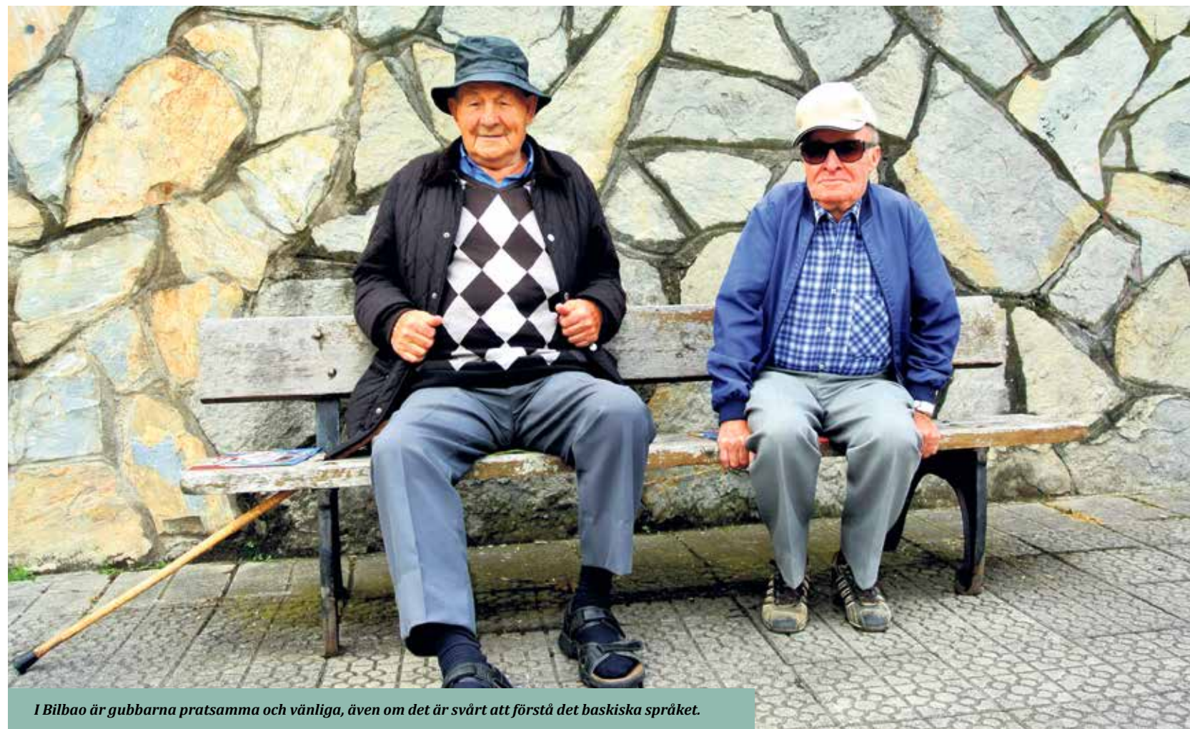
I Bilbao är gubbarna pratsamma och vänliga, även om det är svårt att förstå det baskiska språket.

och turen bjuder på naturupplevelser som tar andan ur oss. Tåget balanserar på stupande klippkanter och det känns som vi behöver ducka när vi dundrar fram genom de låga bergstunnlarna.