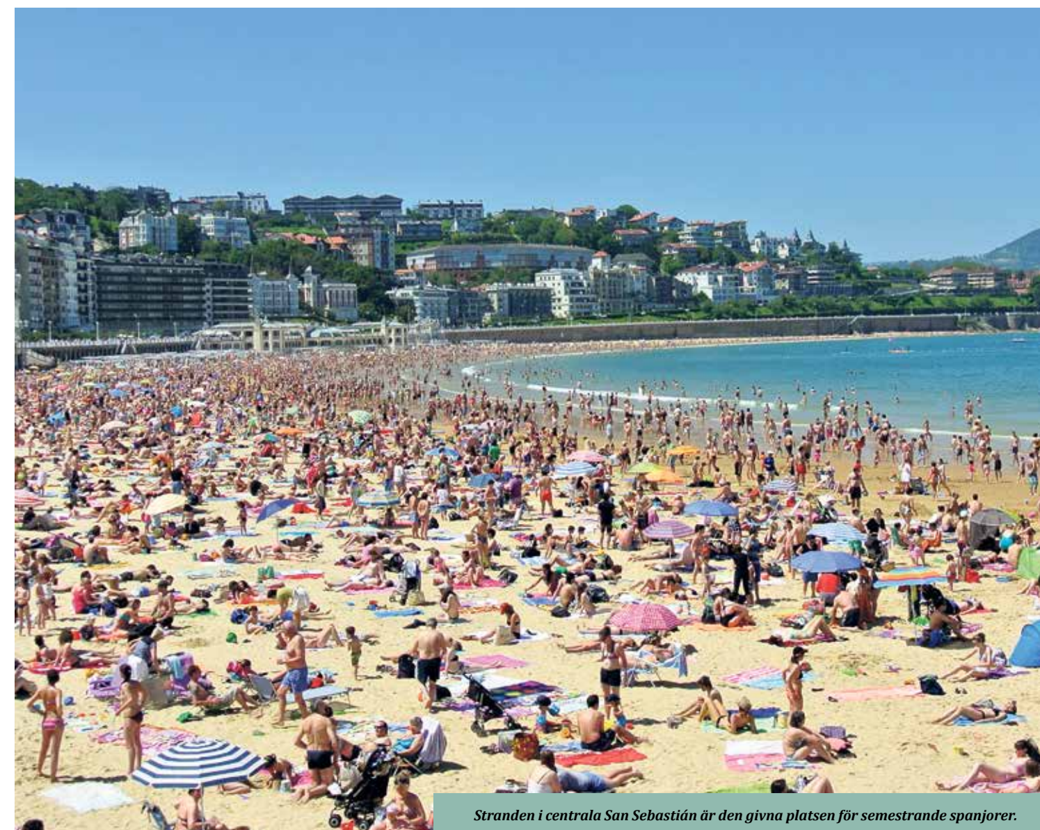
Stranden i centrala San Sebastián är den givna platsen för semestrande spanjorer.

Txakoli heter det torra vinet som görs av druvan hondarribi zuria ( zuria betyder vit, och det finns också röd txakoli, beltza ). Det sticker och poppar i munnen och dansar hela vägen ner i strupen när vi dricker det. Kanske är det kolsyrejazzen