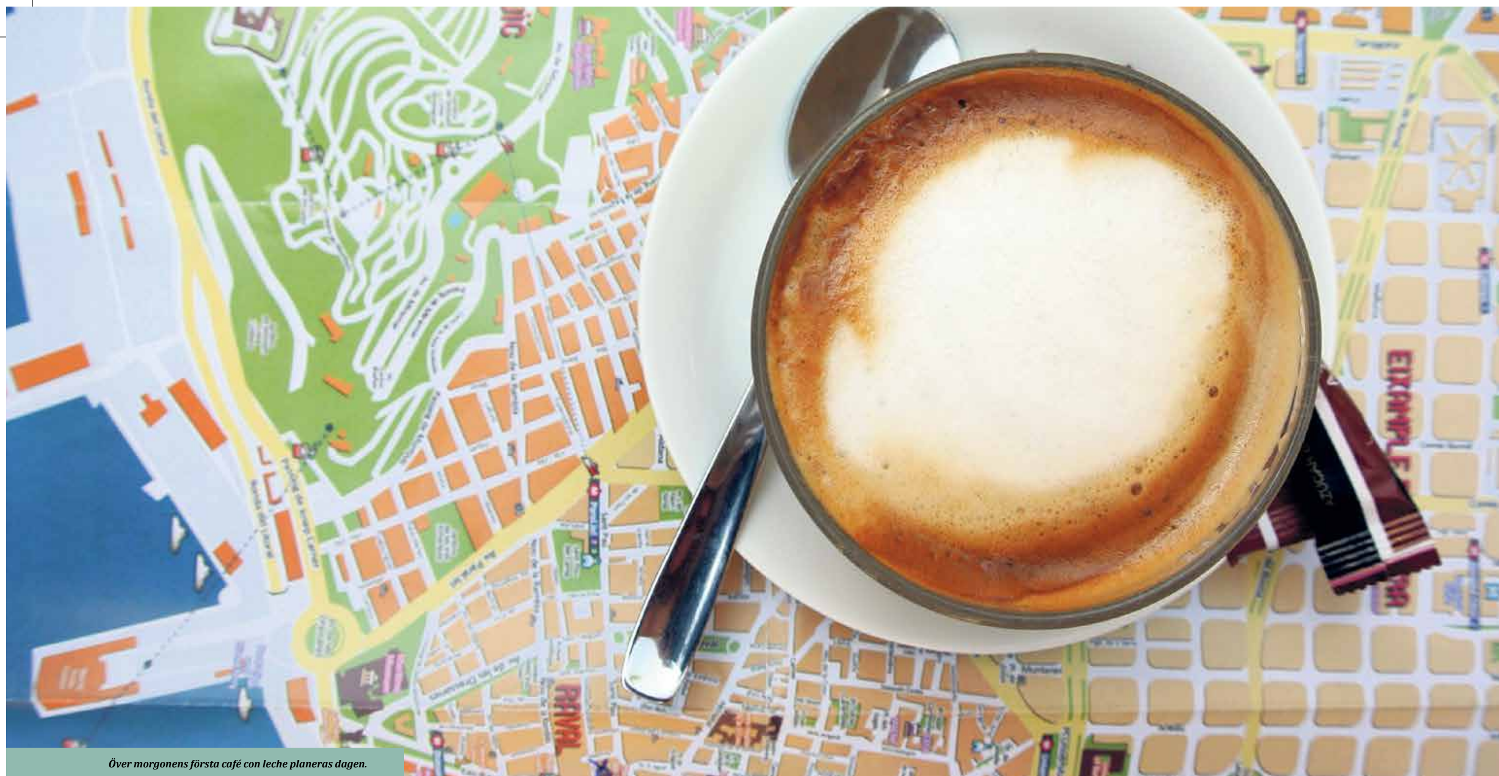
Över morgonens första café con leche planeras dagen.