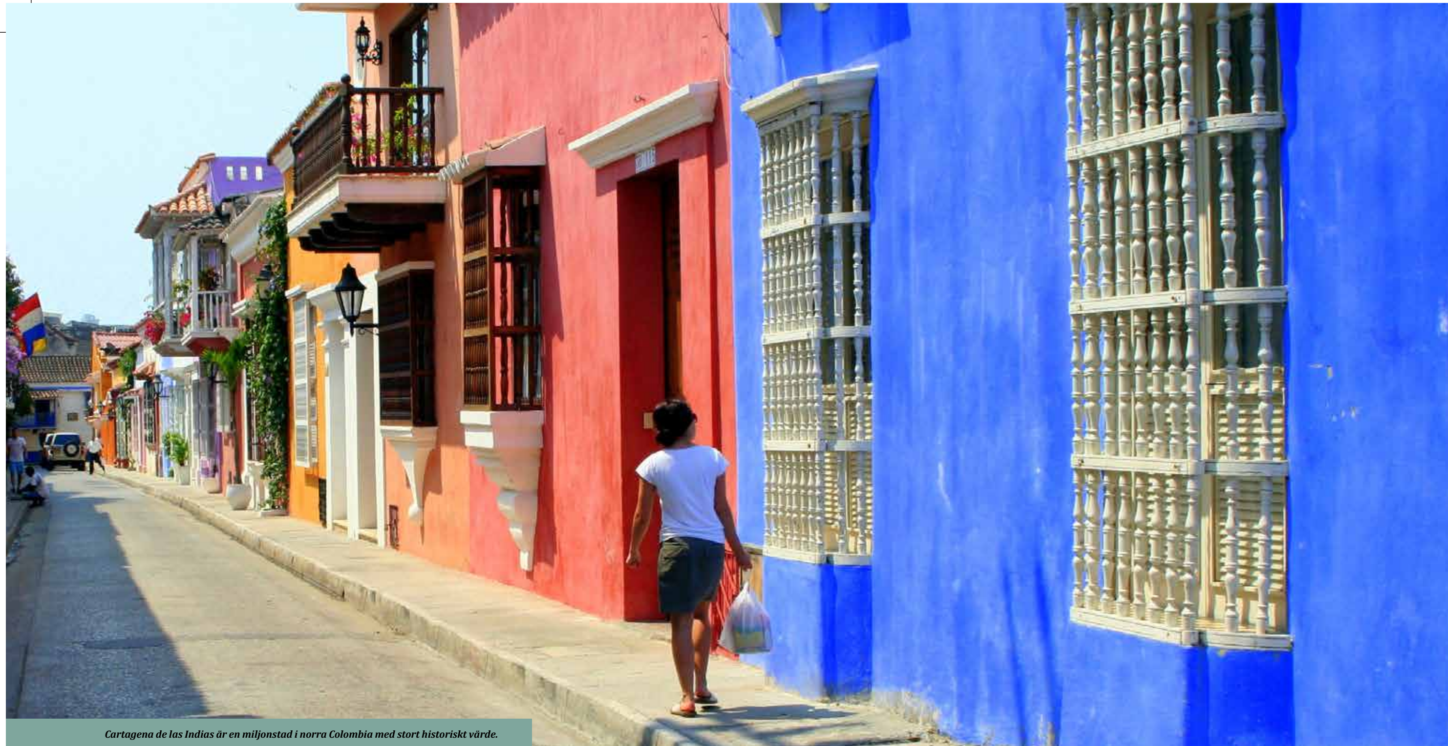
Cartagena de las Indias är en miljonstad i norra Colombia med stort historiskt värde.