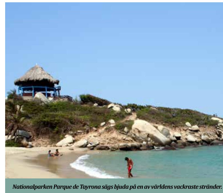
Nationalparken Parque de Tayrona sägs bjuda på en av världens vackraste stränder.

Valuta: Colombianska pesos. 1 SEK är ca 350 pesos.