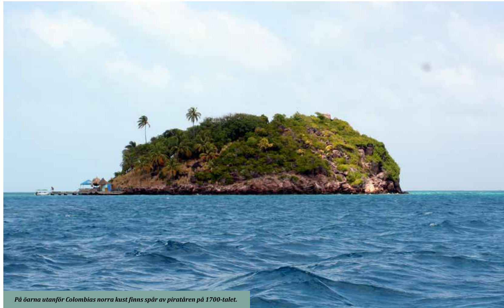
På öarna utanför Colombias norra kust finns spår av piratären på 1700-talet.

broccolibuketter. Tayronas natur är välbevarad, tack vare de strikta reglerna i nationalparken, och därför är enda vägen att komma hit till fots (eller häst). Vandrigen är dock lätt, men värmen, fukten och rygsäckarna gör det ändå ansträngande. Det är mest backpackers, precis som vi, som hänger på campingen Arrecifes. På nätterna har vi stjärnhimlen som tak och på dagarna kan vi inte titta oss trötta nog på horisonten.