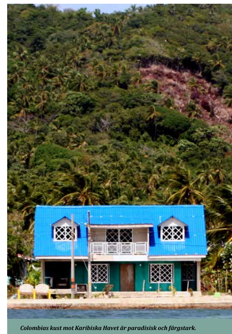
Colombias kust mot Karibiska Havet är paradisisk och färgstarkt.

När stadspulsen har fått oss att nästan nå vår kokpunkt åker vi båt ut i skärgården Islas del Rosario. Här är lunken betydligt lugnare och den karibiska laid back-stilen är given. Små stugor i kulörta färger tycks ha blivit utkastade på öarna och vyn är som tagen ur en piratroman. Det visar sig snart att stugorna är enklare pensionat som erbjuder nattgäster antingen en säng eller hängmatta. Vi väljer det senare och kvartar över natten i paradiset. På kvällen åter vi färsk fisk