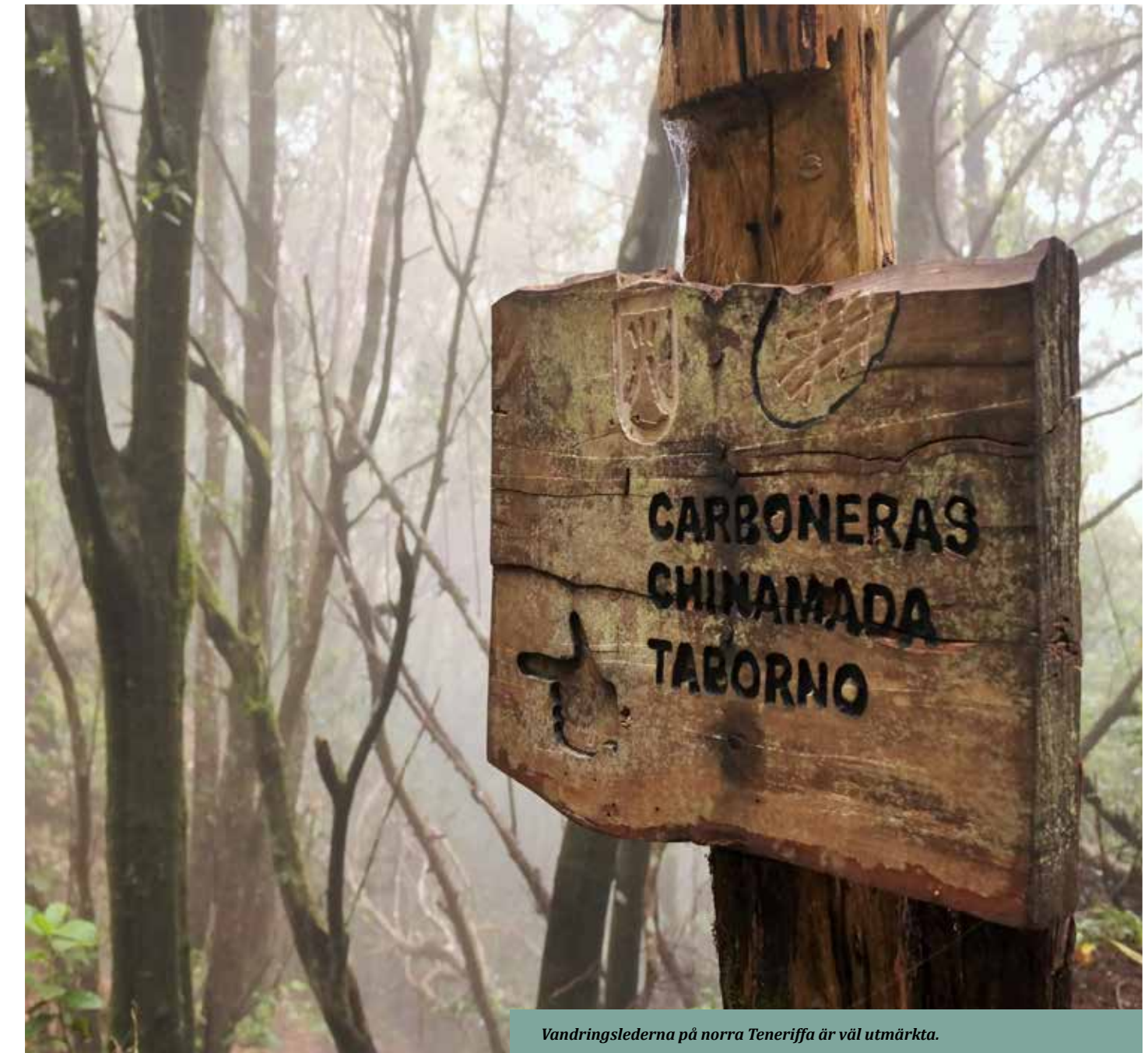
Vandringslederna på norra Teneriffa är väl utmärkt.

Det är enkelt att resa med buss på Teneriffa. Det statliga bolaget Titsa trafikerar hela ön för billiga priser. Bäst