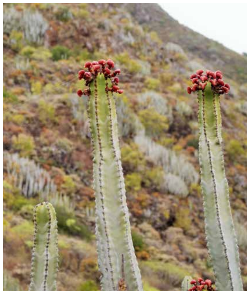
Kaktusar är vanliga i Teneriffas natur.