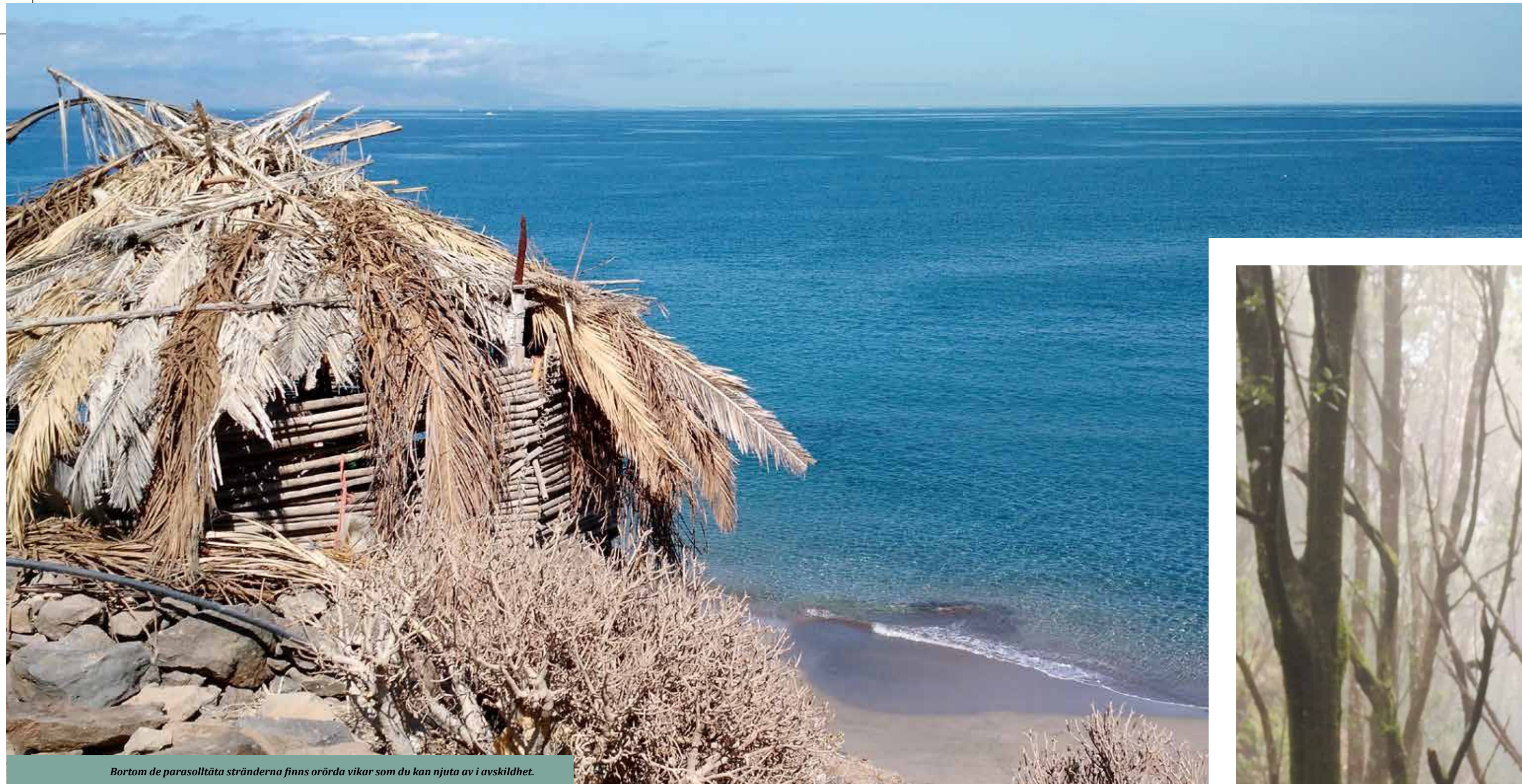
Bortom de parasolltåta stränderna finns orörda vikar som du kan njuta av i avskildhet.