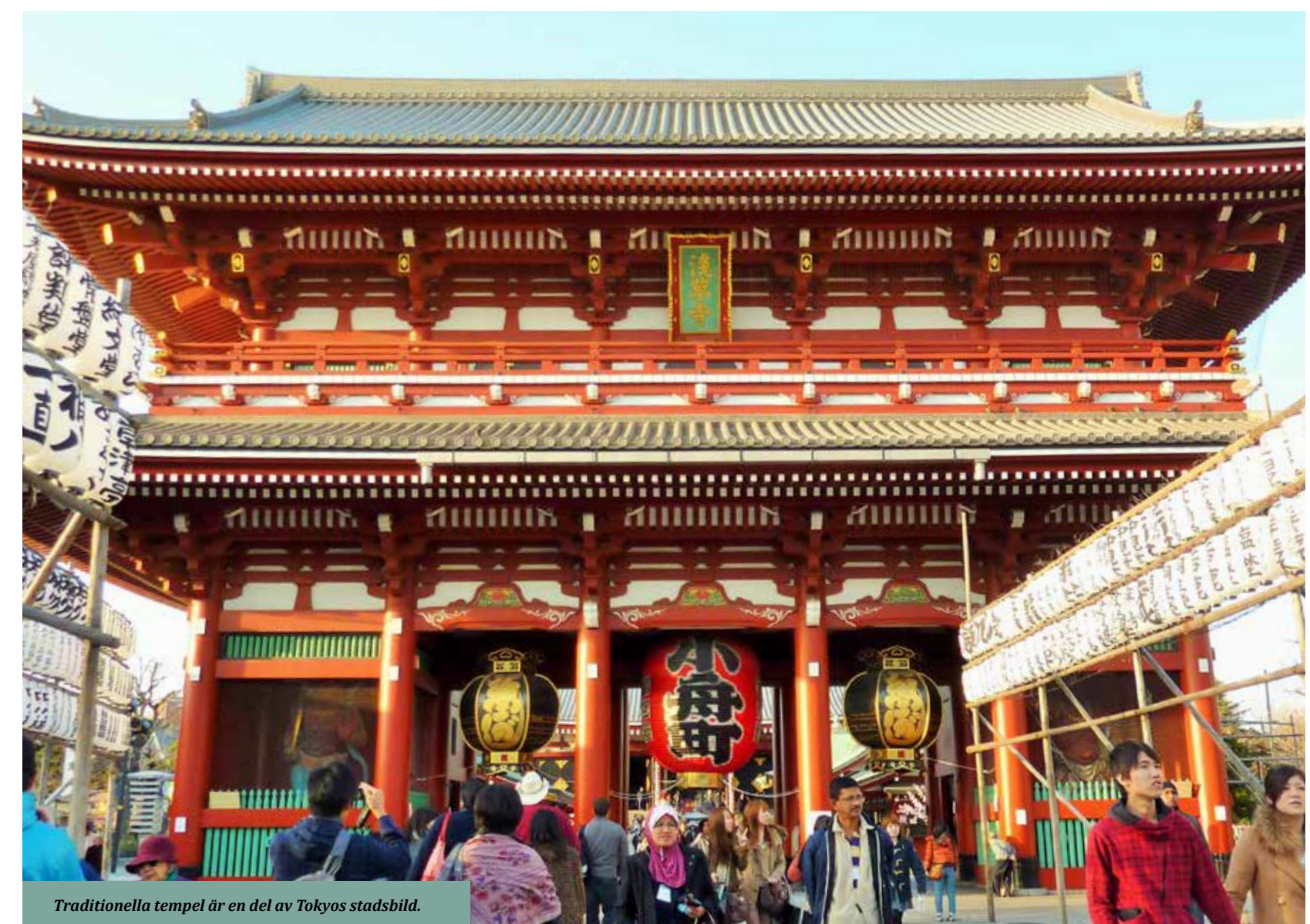
Traditionella tempel är en del av Tokyos stadsbild.

Lika väl som Tokyo är en stad med mycket att göra är det också ett himmelrike för spännande, smakrika maträtter. Ramen är nudelsoppa som värmer ända in i själen, och hittar du ett genuint nudelställe är det dessutom väldigt prisvärt. Räkna med 30-40 kronor för en skål.