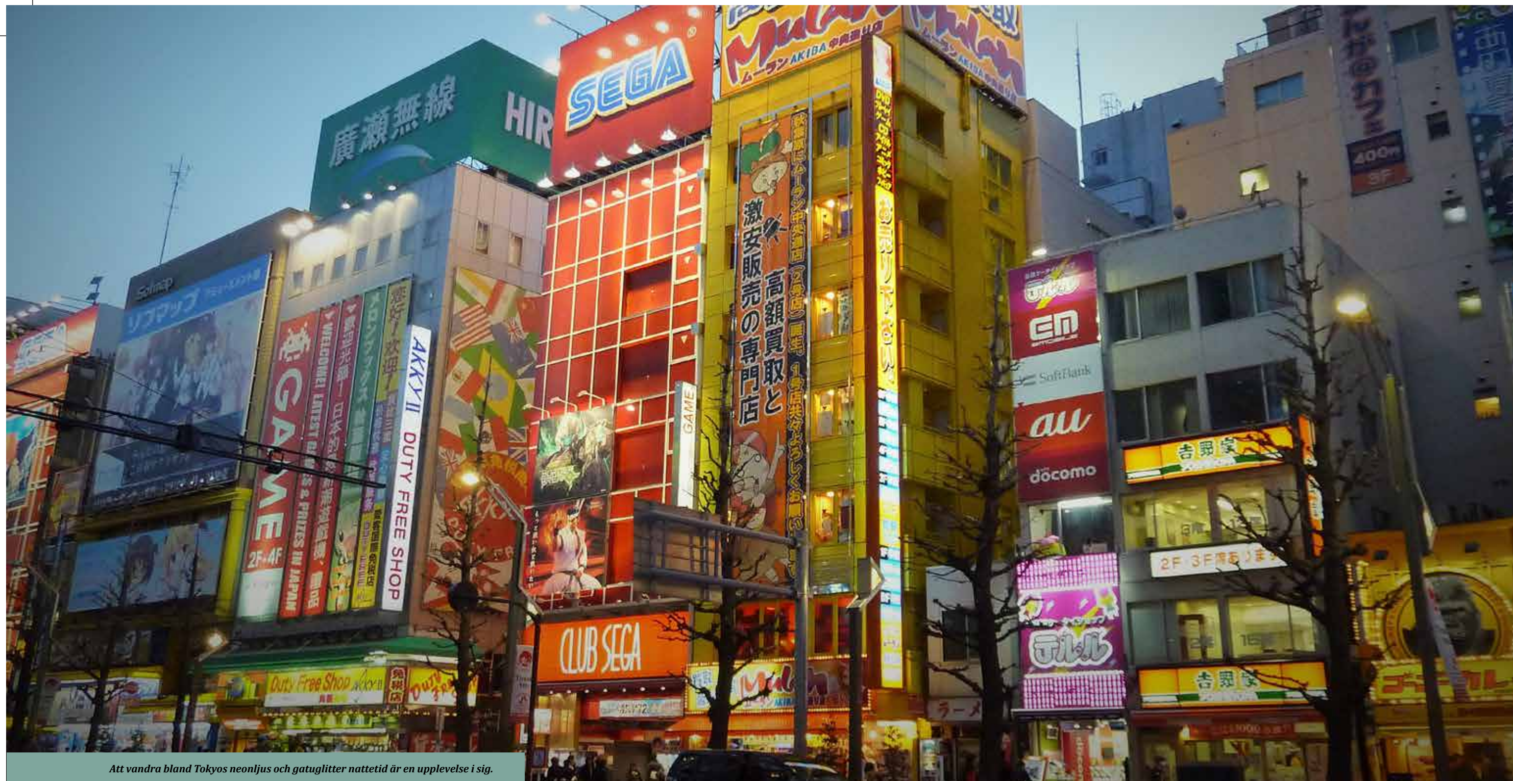
Att vandra bland Tokyos neonljus och gatuglitter nattetid är en upplevelse i sig.