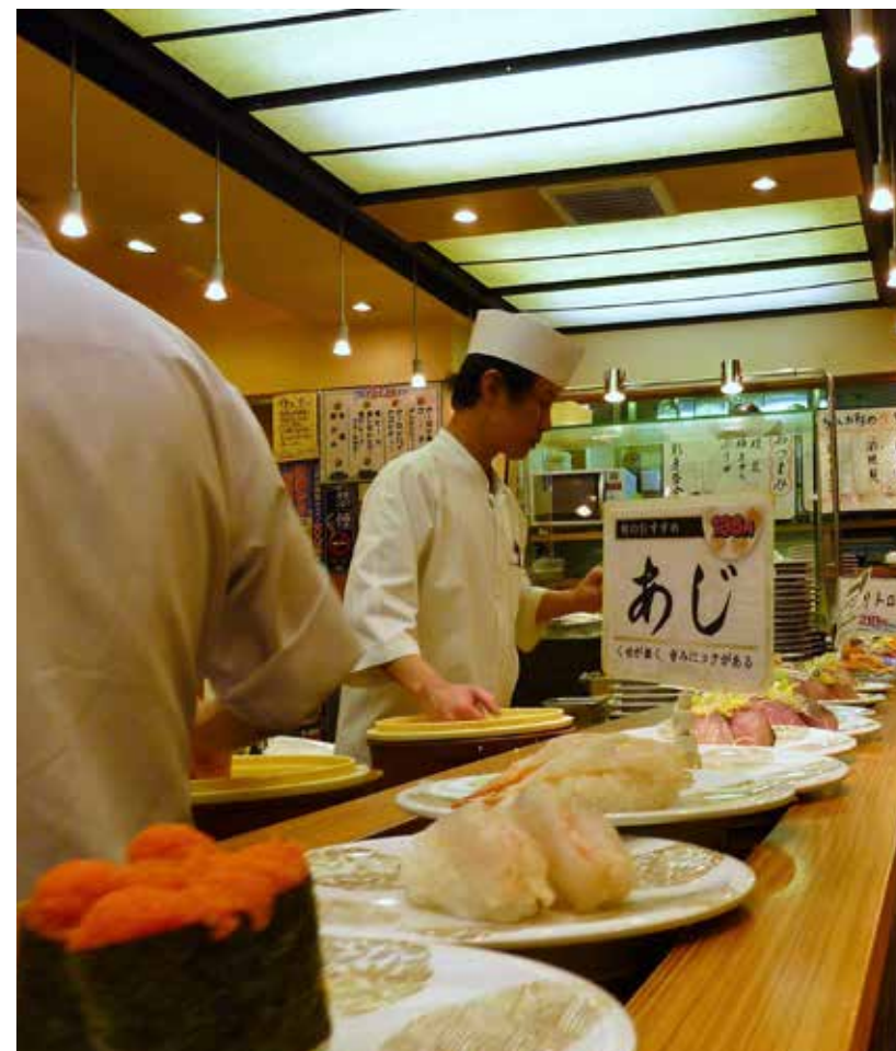
Sushi på rullande band är ett roligt sätt att luncha i Tokyo.