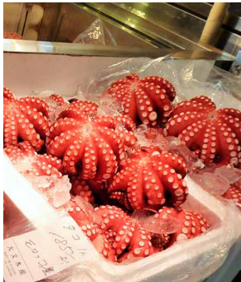
Bläckfisk till frukost på Tsukiji Market.