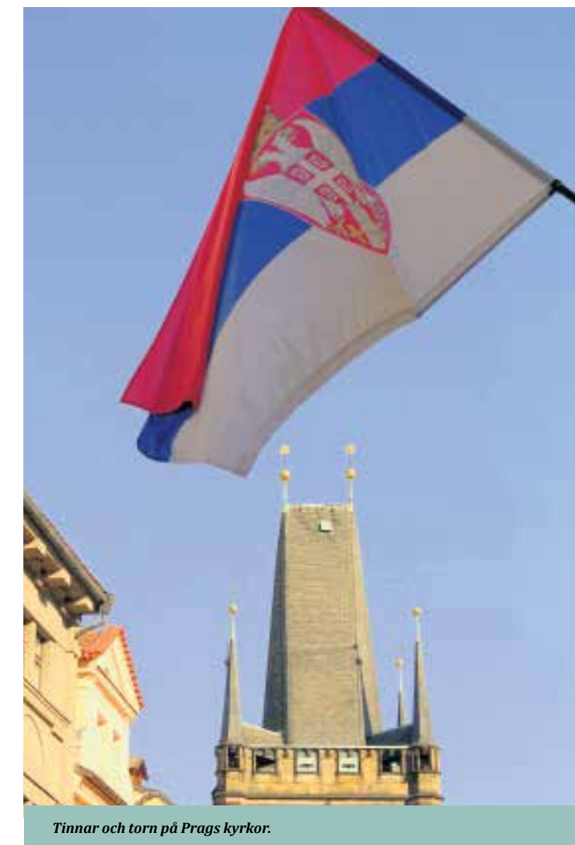
Tinnar och torn på Prags kyrkor.