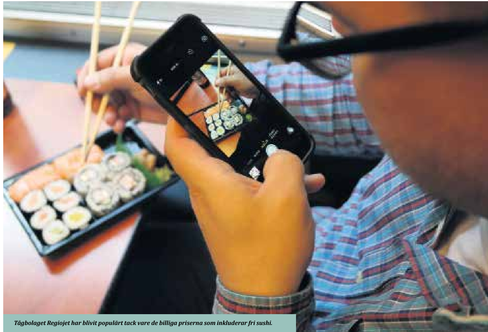
Tågbolaget Regiojet har blivit populärt tack vare de billiga priserna som inkluderar fri sushi.

nästa dag med stärkande mat som halusky, den tjeckiska varianten av knödel, med korv och ostar.