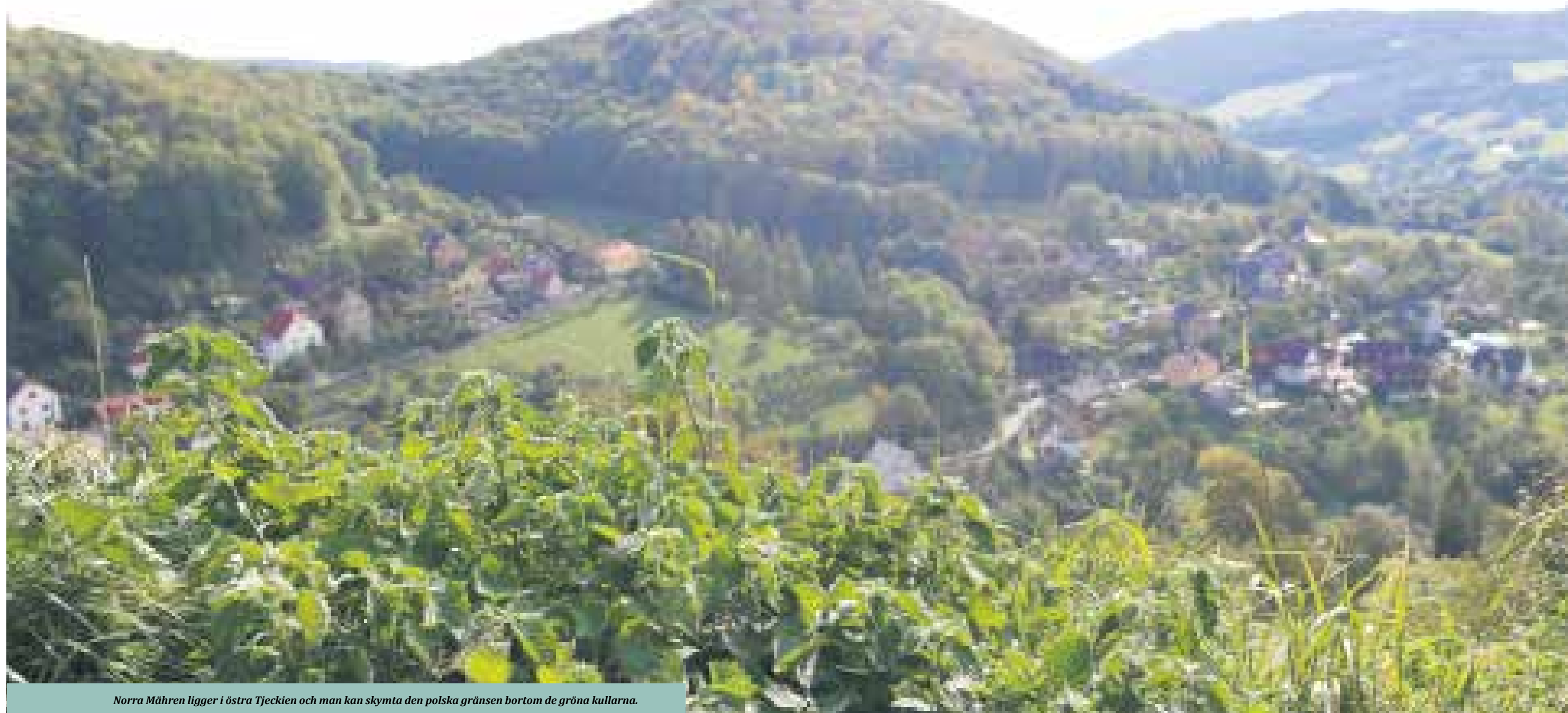
Norra Mähren ligger i östra Tjeckien och man kan skimta den polska gränsen bortom de gröna kullarna.