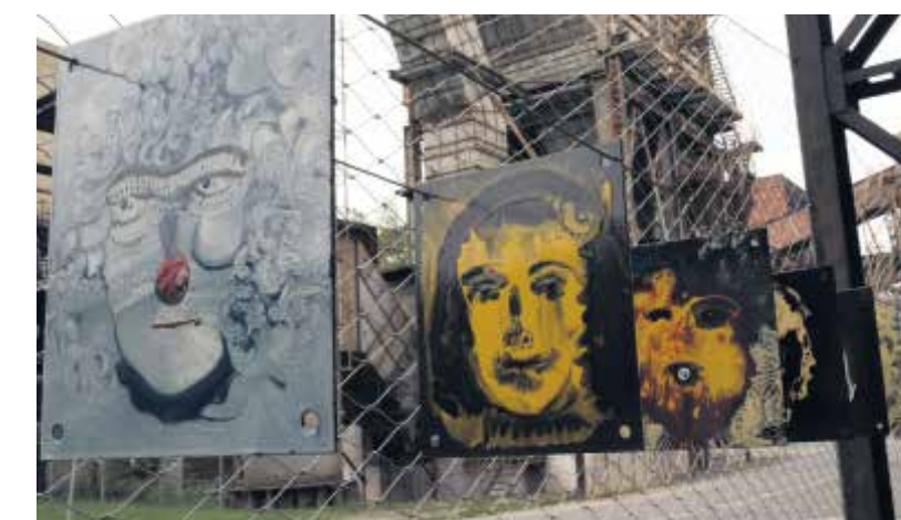
Industrilandskapet har blivit konstgallerier.

JN GYMNASIET GER ALLA EN CHANS www.jn.kumla.se